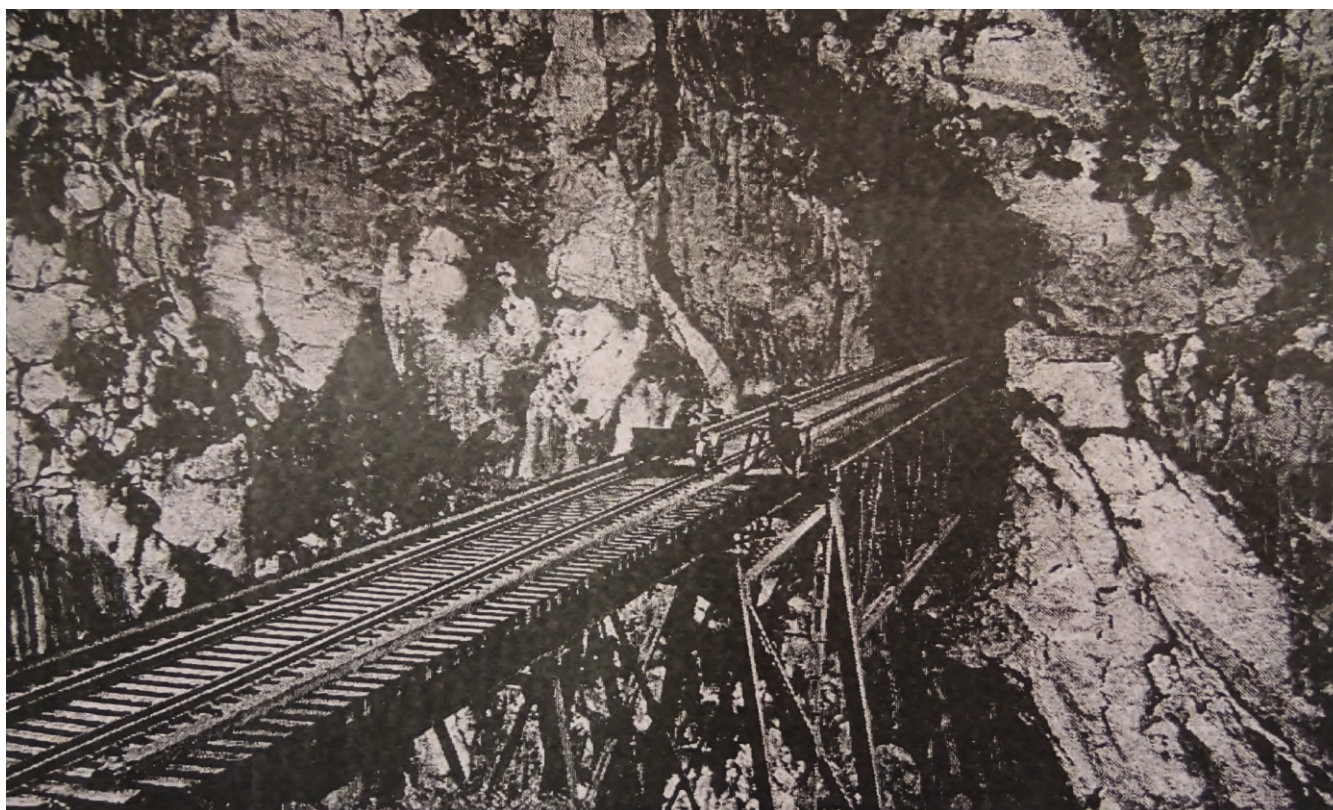
Puente Verrugas, apertura de la ruta, Lima siglo XIX. 2