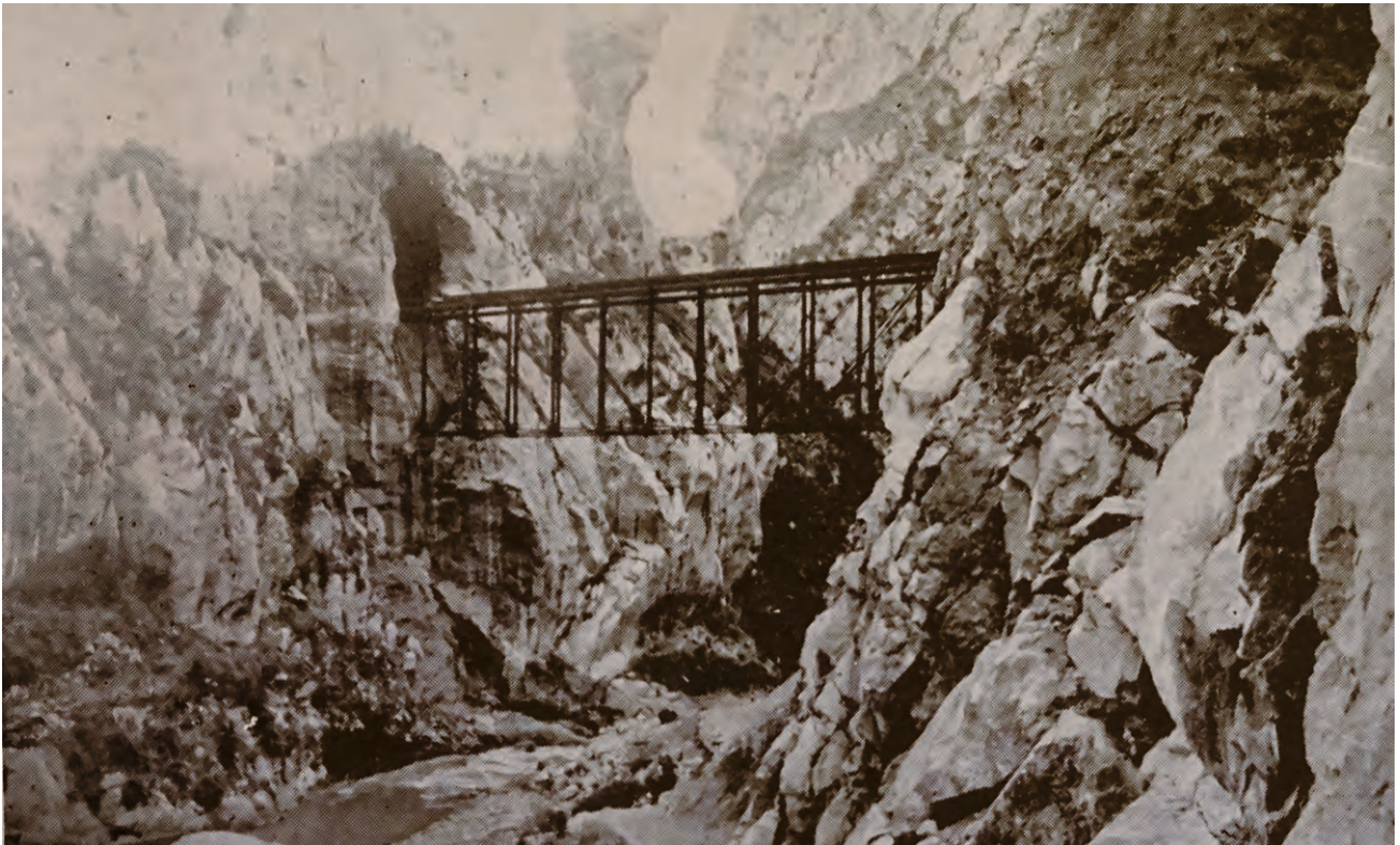
Puente del infiernillo - Huarochirí. 3