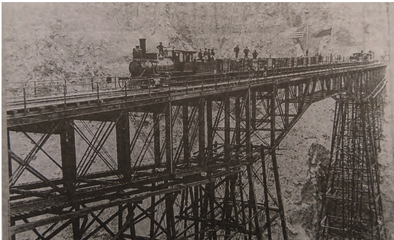
Ferrocarril Central. 1