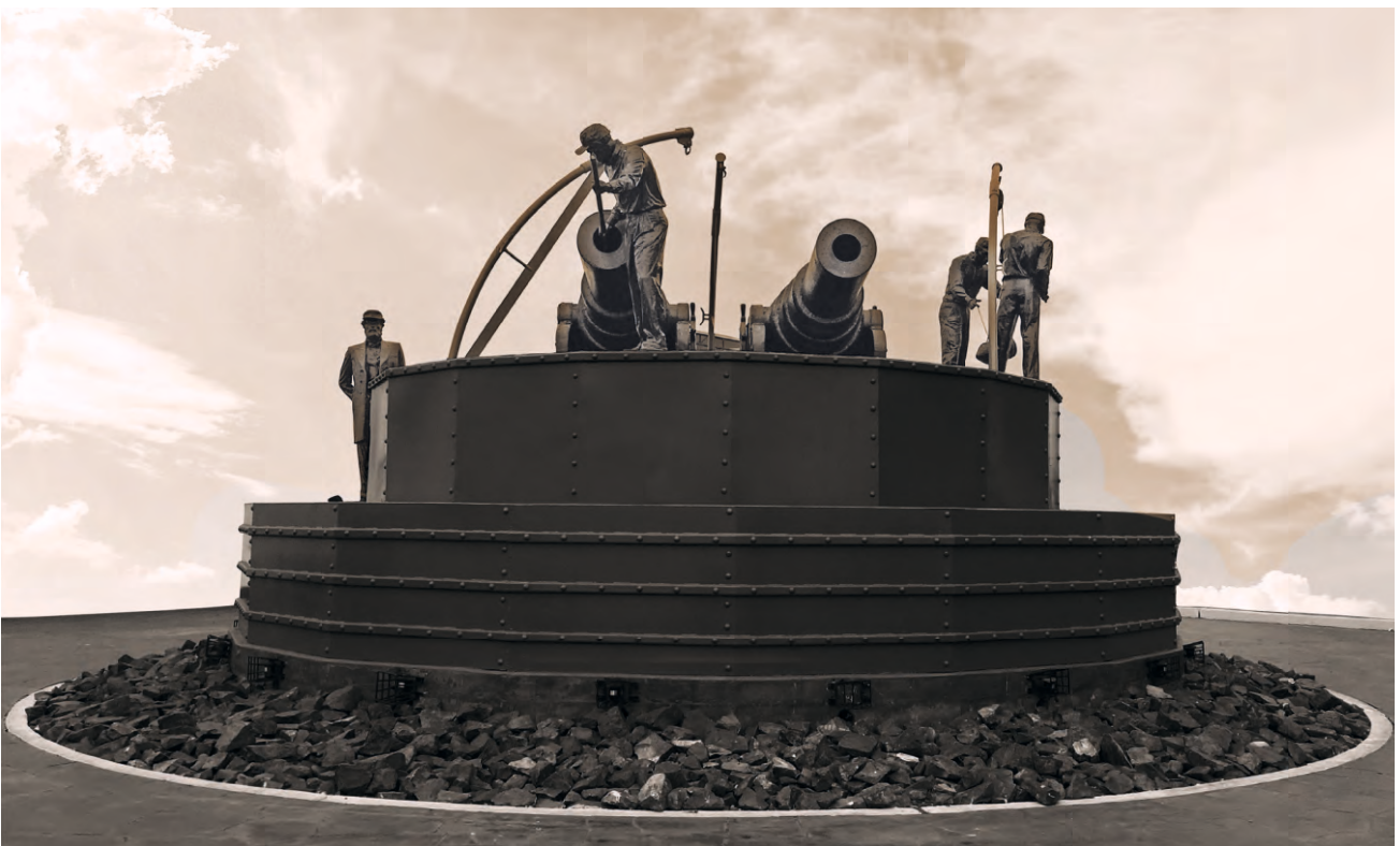
Torre La Merced en la defensa del Callao en 1866.